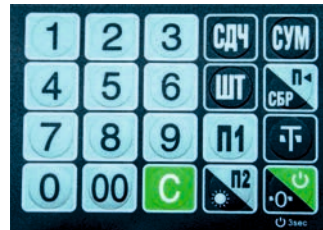
Рис. 3. Клавиатура